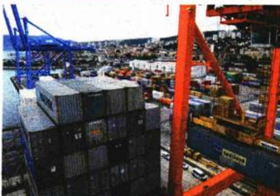
Ulazak Hrvatske u EU otvorio je granice, pogotovo u smjeru Austrije, gdje su dobili novog značajnog partnera

završimo s prometom na razini od oko 4,7 milijuna tona. Ujedno će ova godina biti važna, jer ćemo započeti s gradnjom novog pozadinskog terminala na Škriljevu, a vjerujem da će se pokrenuti i priča s uređenjem terminala za drvo na području platoa bivše bakarske koksare, naglašava Devčić.